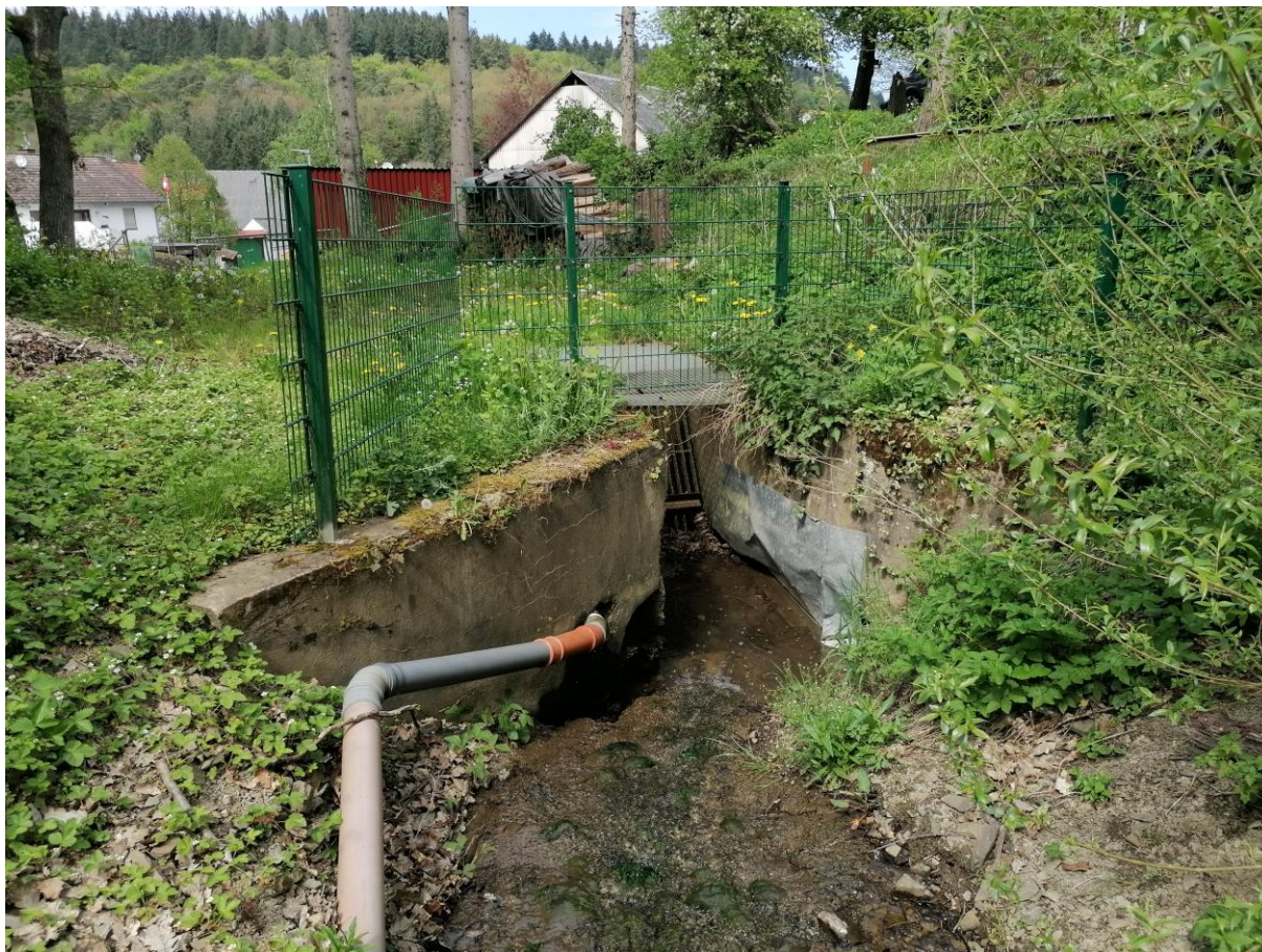
Abbildung 3: Einlaufbauwerk mit Betonflügelwänden und zweidimensionalem Rechen, Blick in Fließrichtung