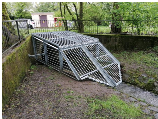
Abbildung 5: Installierter 3D Rechen am Kerkerbach in Waldbrunn