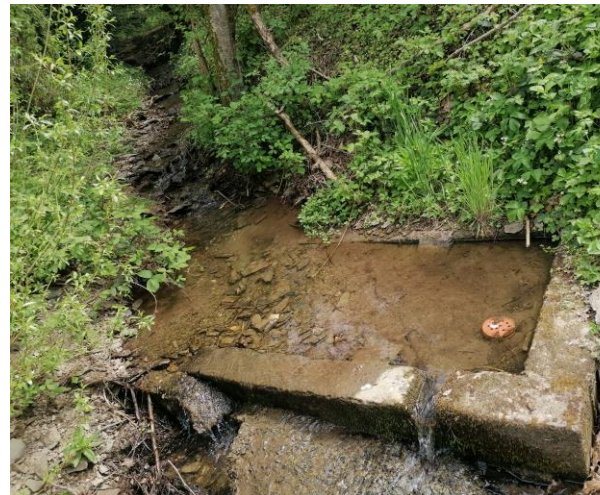
Abbildung 2: Wasserentnahmeeinrichtung am Rimbach, zugesetzt mit Sedimenten