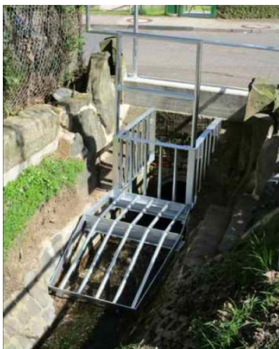
Abbildung 4: Rechen mit "offener" Fläche oben der Stadt Kassel